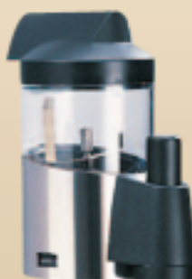
Темпер для кофе