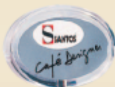
Съёмный держатель этикетки